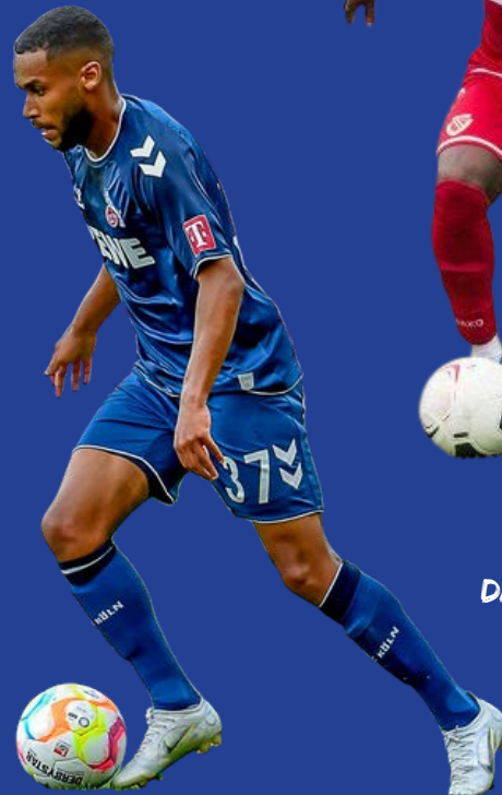
MALCOLM BADU FC ENERGIE COTTBUS, DAVOR SPARTAK MOSKAU, VFL WOLFSBURG