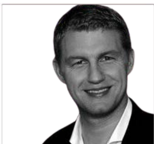
ANDREAS EHSPANNER PROJEKTE