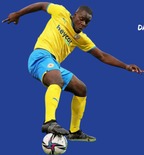
IBA MAY VFL WOLFSBURG U23, ZULETZT EINTRACHT BRAUNSCHWEIG