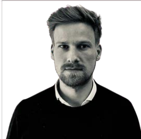
MAURITS SCHÖN PROJEKTE